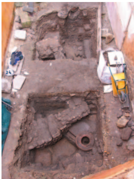
Vista xeral das sondaxes

das sobre o sábreo natural, enterrándose naquela primeira camada de nivelación (UE.1223). Puidese tratarse dun treito de muro reaproveitado dunha construción preexistente, relacionada co primeiro nivel de ocupación, sempre nun horizonte medieval. O treito S é de mellor factura, dentro da mediocridade, cimentándose na potente camada de recheo con material romano e medieval (UE.1109). O treito W parece ter sido construído nun momento posterior, a xulgar pola gabia de cimentación, que cortaba un nivel de sábreo