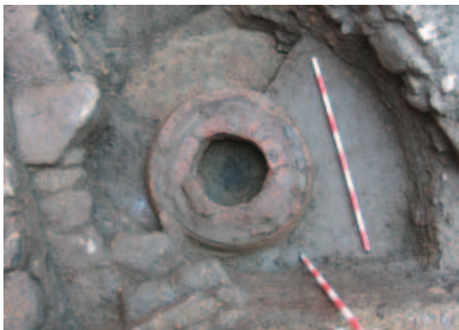
Detalle da estrutura circular de ladrillo

das sobre o sábreo natural, enterrándose naquela primeira camada de nivelación (UE.1223). Puidese tratarse dun treito de muro reaproveitado dunha construción preexistente, relacionada co primeiro nivel de ocupación, sempre nun horizonte medieval. O treito S é de mellor factura, dentro da mediocridade, cimentándose na potente camada de recheo con material romano e medieval (UE.1109). O treito W parece ter sido construído nun momento posterior, a xulgar pola gabia de cimentación, que cortaba un nivel de sábreo