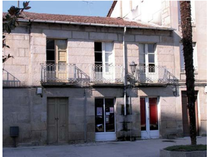
Fachada do predio

Os muros desta ampliación asentaban os seus alicerces sobre unha camada de terra escura –de horta–, duns 0,50 m