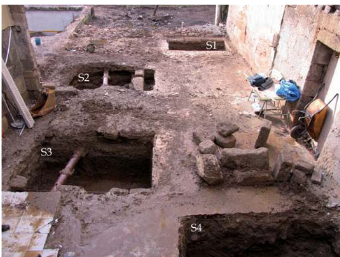
Vista xeral das sondaxes

Con todo, a falla de restos arqueolóxicos axúdanos a ir definindo a extensión do Verín romano, do cal nada fai pensar da súa extensión por esta parte da vila. Os restos dunha suposta villa máis ao E, no soar do Cine Buenos Aires, estudados por Taboada Chivite, ou a presenza dun pozo datado no último terzo do século I d. C. no soar contiguo, na esquina entre a rúa da Mercedes e a avenida Luis Espada, parecen falarnos dunhas instalacións de tipo agrícola nas aforas do núcleo principal do Verín romano. O centro deste situaríase no contorno da igrexa de Santa Mariña, onde apareceron os únicos restos estruturais da época atopados ata o de agora. □