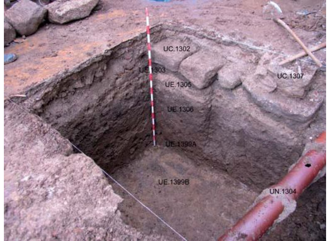
Imaxe da esquerda: restos da edificación do século XIX en S3. Dereita: estratigrafía completa en S3

Estes fragmentos foron moi residuais e non se pode relacionalos con ningún tipo de estrutura, nin tan sequera cun nivel arrasado desa cronoloxía, como si sucedeu no soar contiguo, escavado por D. Manuel García Valdeiras no ano 2001.