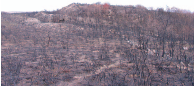
Croa e defensas do Castro da Cividá

Outra novidade destacada foi a aparición dun fragmento de cerámica campaniforme no Pereiral, cubrindo un baleiro cronolóxico. Apareceu este fragmento nunha acu-