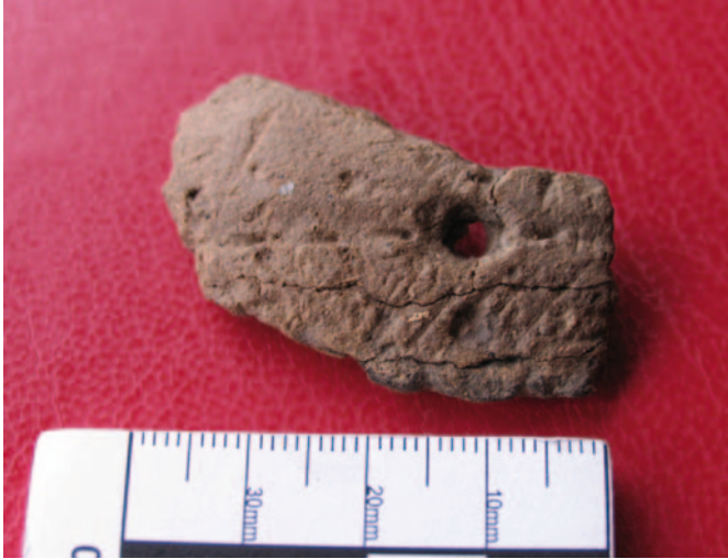
Fragmento de cerámica campaniforme do Pereiral

sas coa proximidade ás terras de labor máis fértiles. Estas circunstancias danse tanto na Perdida (xac.004) coma nos Castros da Cividá (xac.001). En ambos se estenden terreos chairros pola súa parte SW, empregada como acceso aos recintos habitados.