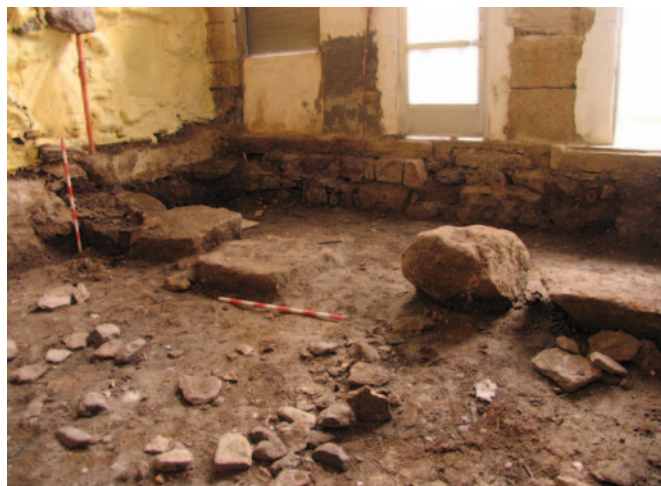
Interior do soar despois do recheo do firme actual

Sobre ese nivel, e amortizado co nivel de recheo superior, apareceron catro grandes cachotes graníticos aliñados en paralelo respecto da fachada, separados desta 1,70 m. Corresponden estes grandes cachotes á cimentación da fachada dunha construción preexistente, de 0,90 m de anchura, cun oco doutros 0,90 m no centro, que nos indica a antiga entrada. A aliñación destes cachotes coincide coa liña de fachada do predio n.º 5 contiguo. Coincide tamén coa deste, e coa doutros edificios vellos da mesma rúa, a cota interior, uns 0,70 m por baixo da cota exterior da rúa. Seguramente, no soar n.º 3, a edificación anterior á actual fose de idénticas características á do soar n.º 5, con muros de carga de cachotería e unha soa altura, destinado hoxe a corte de gando.